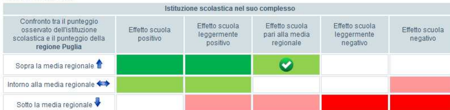
Tavola 9B Matematica