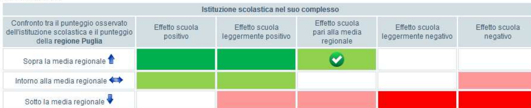
Tavola 9A Italiano